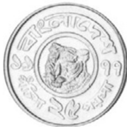
25 poisha 1977 rok