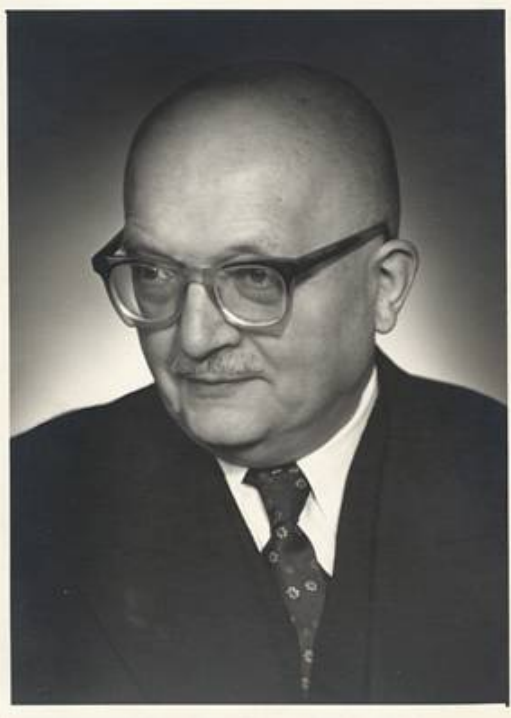
Tadeusz Kałowski (1899 – 1979)