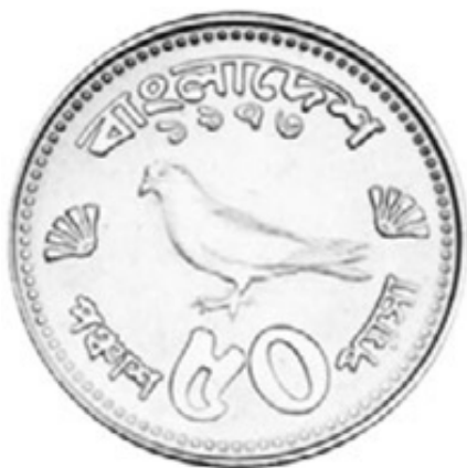
50 poisha 1973 rok