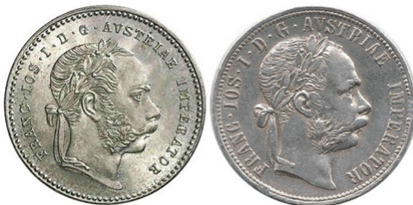
Ryc. 3. Awersy 20 krajcarów z 1872r oraz florena z 1884r