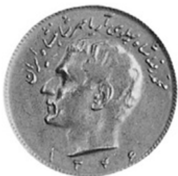
Awers monety irańskiej 10 riali 1349 + 621 = 1970 AD