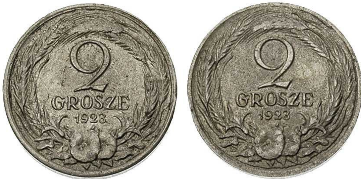
WCN aukcja 33, pozycja 776