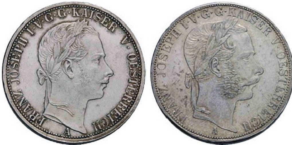
Porównanie awersów florenów z 1865r i 1866r

Można by rzec, że pierwszym skowronkiem nadchodzących zmian jest istotna zmiana podobizny władcy Austrii na monetach cesarstwa, do której doszło w 1866r. Wyraźnie to widać porównując awersy z tego roku i poprzedzającego go (ryc.1).