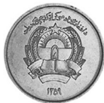
Awers monety afgańskiej 1 afgani 1359 + 621 = 1980 AD

Na niektórych monetach Irańskich z lat 1976-1980 AD daty przedstawione są według monarchicznego kalendarza słonecznego (MS). Aby przeliczyć datę z tego kalendarza na kalendarz gregoriański należy odjąć liczbę 559.