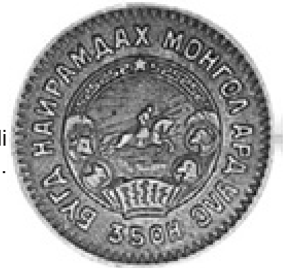
Awers monety 2 mango z 35 roku kalendarza mongolskiego czyli 1945 A.D.

Poszczególne lata nosiły nazwy odzwierzęce - rok tygrysa, wołu, zająca (w sumie było ich 12). Pełny cykl 60 lat uzyskiwano kombinując znaki zodiakalne z pięcioma kolorami. Rok 1911 stał się początkiem nowej ery i na monetach bitych przed końcem II Wojny Światowej widzimy roczniki dwucyfrowe - rok 1925 zapisywany jest jako rok 15.