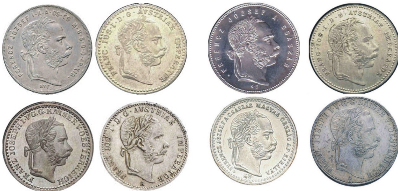
Ryc. 2. Niektóre awersy monet Cesarstwa z okresu 1862-1872

Franciszek Józef I został koronowany koroną św. Stefana na króla Węgier 8 czerwca 1867r. Dla numizmatyków istotne zaś jest to, że od 1868r mamy do czynienia niejako z podwójnym systemem monetarnym -pomimo istnienia unii monetarnej monety dla Przedlitawii (część austriacka) i Zalitawii (część węgierska) różniły się od siebie nazwą waluty, legendami oraz rysunkami awersów i rewersów.