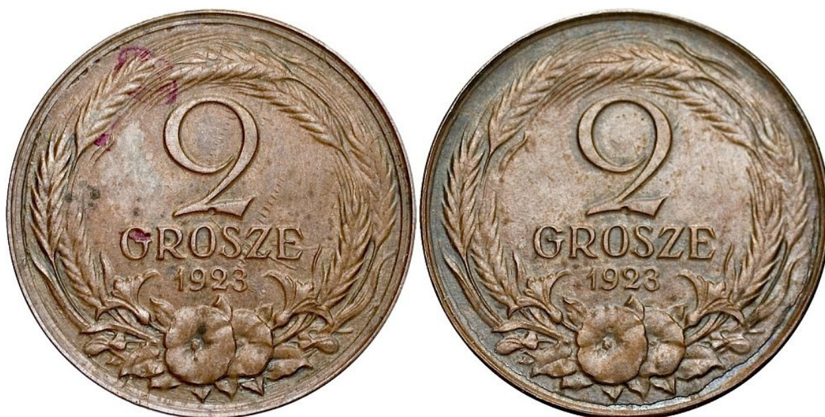
PDA aukcja 13, pozycja 961