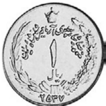
Awers monety irańskiej 1 rial 2537 MS – 559 = 1978 AD

Na niektórych monetach Irańskich z lat 1976-1980 AD daty przedstawione są według monarchicznego kalendarza słonecznego (MS). Aby przeliczyć datę z tego kalendarza na kalendarz gregoriański należy odjąć liczbę 559.