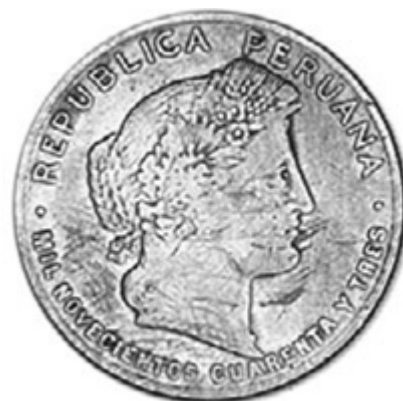
20 centavos 1943 rok