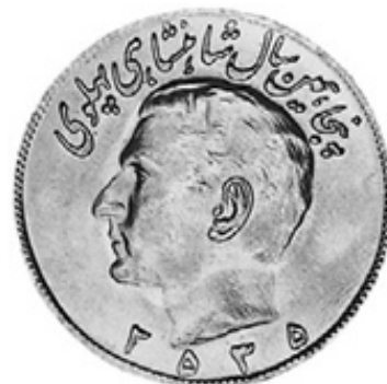
Awers monety irańskiej 20 riali 2535 MS – 559 = 1976